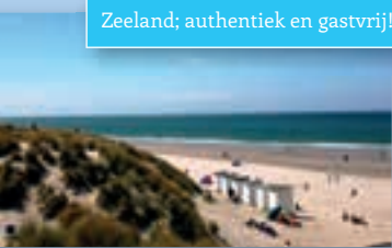
Zeeland; authentiek en gastvrij!