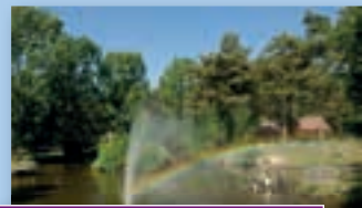
Limburg; onvergetelijk en mooi!