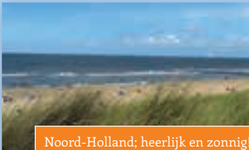
Noord-Holland; heerlijk en zonnig!