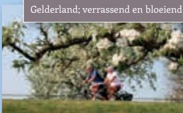
Gelderland; verrassend en bloeiend!