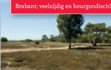
Brabant; veelzijdig en bourgondisch!