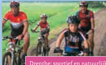
Drenthe; sportief en natuurlijk!