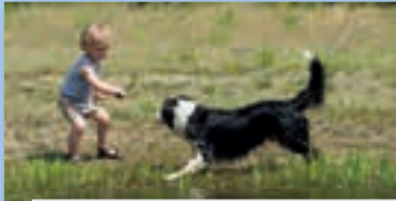
Overijssel; fantastisch en gemoedelijk!